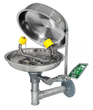
Göz Duşu Kapağı