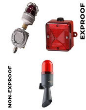
Görsel ve İşitsel Alarm