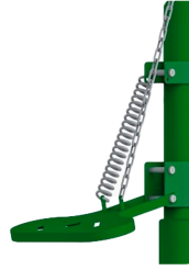
Ayak Pedal Kumandası