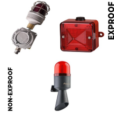
Görsel ve İşitsel Alarm