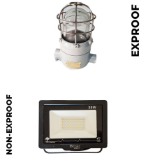
İç & Dış Kabin Aydınlatma