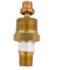
Kaynar Su Önleyici Vana