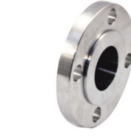
Flanşlı Su Girişi