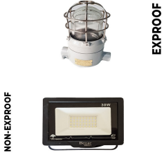
İç & Dış Kabin Aydınlatma