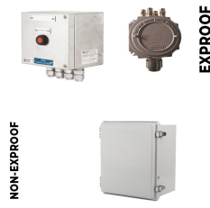
Elektrik Bağlantı Kutusu