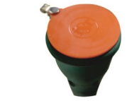
Kauçuk Toz Kapağı