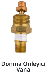
Donma Önleyici Vana