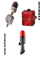
Görsel ve İşitsel Alarm