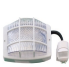
Yakınlık & Hareket Sensörü