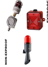
Görsel ve İşitsel Alarm