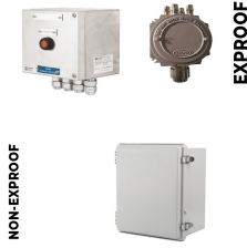
Elektrik Bağlantı Kutusu