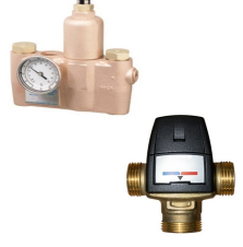
Sıcak & Soğuk Su Karıştırıcı Vana