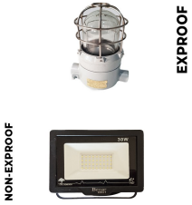
İç & Dış Kabin Aydınlatma