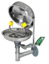
Göz Duşu Kapağı