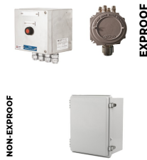
Elektrik Bağlantı Kutusu