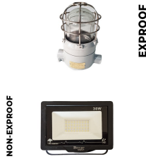
İç & Dış Kabin Aydınlatma