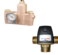
Sıcak & Soğuk Su Karıştırıcı Vana