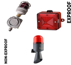
Görsel ve İşitsel Alarm