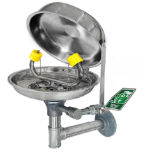
Göz Duşu Kapağı