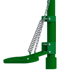
Ayak Pedal Kumandası