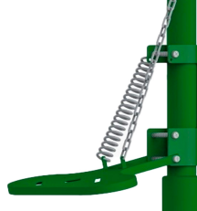
Ayak Pedal Kumandası