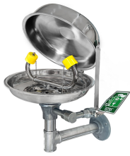
Göz Duşu Kapağı