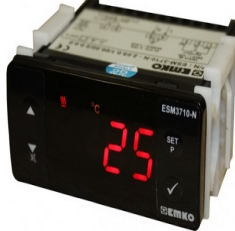
Su Sıcaklık Göstergesi