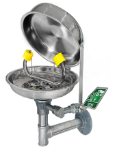
Göz Duşu Kapağı