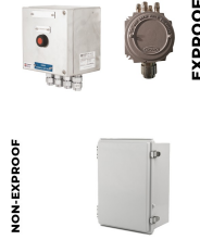
Elektrik Bağlantı Kutusu