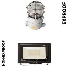
İç & Dış Kabin Aydınlatma