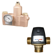
Sıcak & Soğuk Su Karıştırıcı Vana