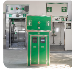
İzolasyonlu Paneller ve Yaylı Kapılar