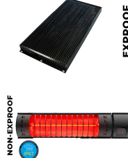
Kabin İçi Isıtıcı