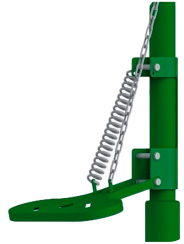
Ayak Pedal Kumandası