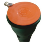
Kauçuk Toz Kapağı