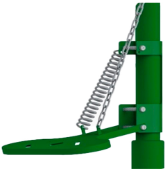
Ayak Pedal Kumandası