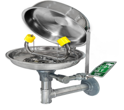
Göz Duşu Kapağı