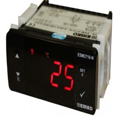
Su Sıcaklık Göstergesi