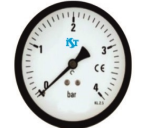
Su Basınç Göstergesi