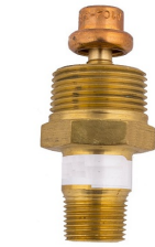
Donma Önleyici Vana