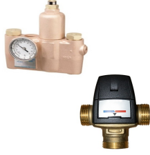
Sıcak & Soğuk Su Karıştırıcı Vana