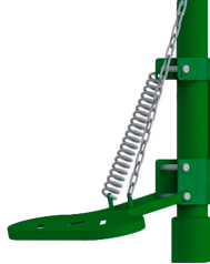
Ayak Pedal Kumandası