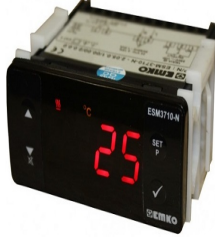
Su Sıcaklık Göstergesi