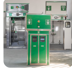
İzolasyonlu Paneller ve Yaylı Kapılar